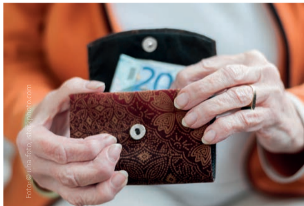
Niemals Geld an unbekannte Personen übergeben