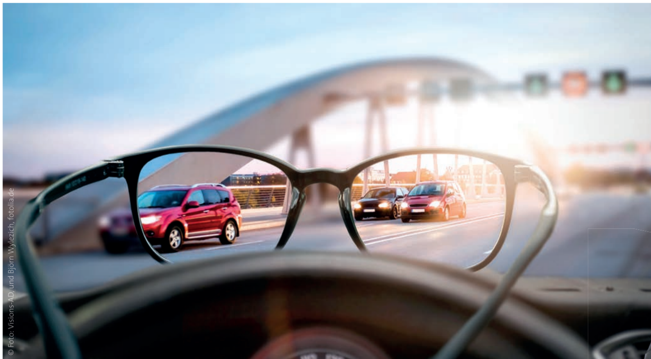
Ganz wichtig: einmal im Jahr zum Seh- und Hörtest