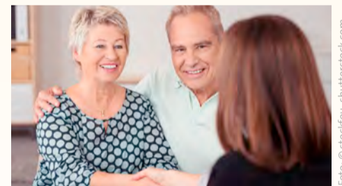
Pflege, Betreuung und Beratung gehören im Pflegezentrum WEST zusammen.

MIT UNSEREM BERATUNGS- UND SCHULUNGSANGEBOT sprechen wir Menschen an, die Fragen rund um die häusliche Versorgung haben. Wir setzen dazu geschulte und erfahrene Pflegefachkräfte ein, die in unseren gut ausgestatteten Schulungsräumen