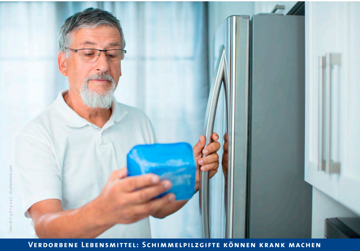
Den Kühlschrank mit System einräumen und den Überblick behalten.

VERDORBENE LEBENSMITTEL: SCHIMMELPILZGIFTE KÖNNEN KRANK MACHEN