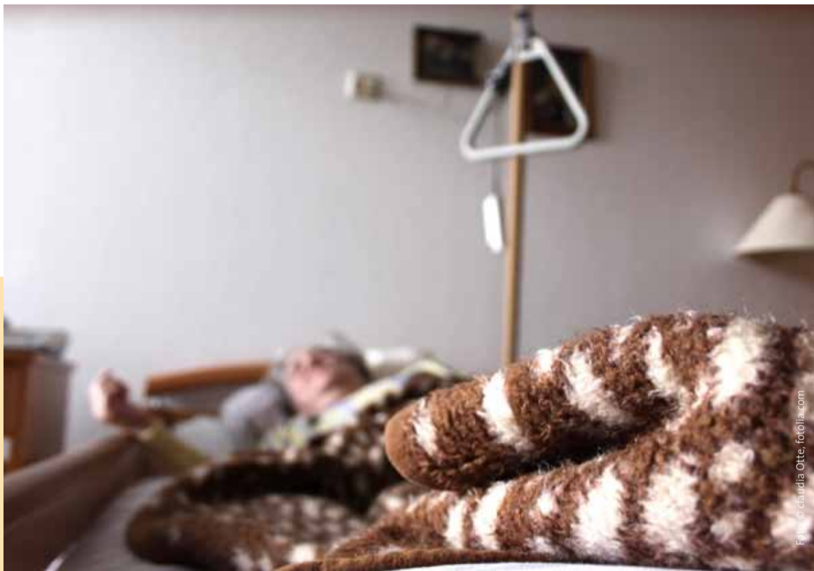
Fixierungen und hochgezogene Bettgitter schaffen keine Sicherheit, sondern ein hohes Verletzungsrisiko!

heit und die Lebensqualität sowohl des kranken Menschen als auch der Angehörigen. Möglich wird das heutzutage nicht zuletzt durch technische Hilfsmittel. Technik kann helfen, die Sicherheit und Lebensqualität zu erhöhen: GPS, Sensortechnik, intelligente Fußböden, Niederflurbetten, Hüftschutzhosen, Mobilfunkkommunikation sind erprobte technische Helfer. Zur Lebensqualität gehört aber unbedingt auch die Gewissheit, teilhaben zu können, akzeptiert zu sein, nicht kontrolliert zu werden. Deshalb sind die Gefahren des Technikeinsatzes zu bedenken: Technik kann auch zur weiteren Kontrolle eines kranken Menschen führen. Dann gewinnt der Sicherheitsaspekt wieder die Oberhand.