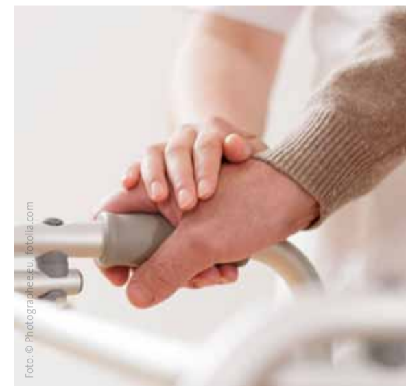
Das neue Pflegegesetz eröffnet neue Hilfen.

ge Richtung ist. Bei unserer täglichen Arbeit stellen wir schon seit jeher den ganzen Menschen in den Fokus. Um das neue Gesetz organisatorisch entsprechend umzusetzen, stellen wir auf das neue Dokumentationssystem SIS (Strukturierte Informationssammlung) um. Es ist genau wie das NBA darauf ausgelegt, die Fähigkeiten des Menschen in verschiedenen Lebensberei-