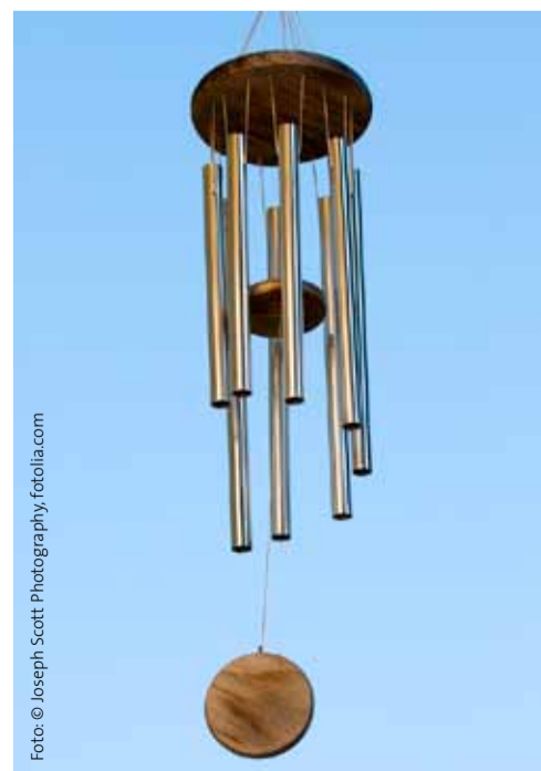
Sanftes Signal – ein Windspiel in Türnähe

DIESE UND ANDERE Erkenntnisse haben Wissenschaftler der Evangeli-